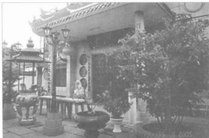
Thảo Đường thiền tự.