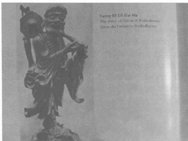
Tượng Bồ Đề Đạt Ma

Vào thế kỷ XVII, Phật giáo Đại thừa Trung Quốc có tác động mạnh mẽ đến xứ Đàng Trong qua sự truyền bá trực tiếp của các thiền sư Trung Quốc, mang phái Thiền Lâm Tế vào Đàng Trong. Hình thức tín ngưỡng tôn thờ các vị tổ, đặc biệt là vị sơ tổ sáng lập ra dòng Thiền, càng được đặc biệt tôn kính. Chính vì vậy, hầu hết các chùa ở Nam Bộ, dù là ngôi chùa cổ hay mới vừa được xây dựng gần đây, trên bàn thờ tổ, thường đặt tượng Bồ Đề Đạt Ma để ngưỡng vọng.