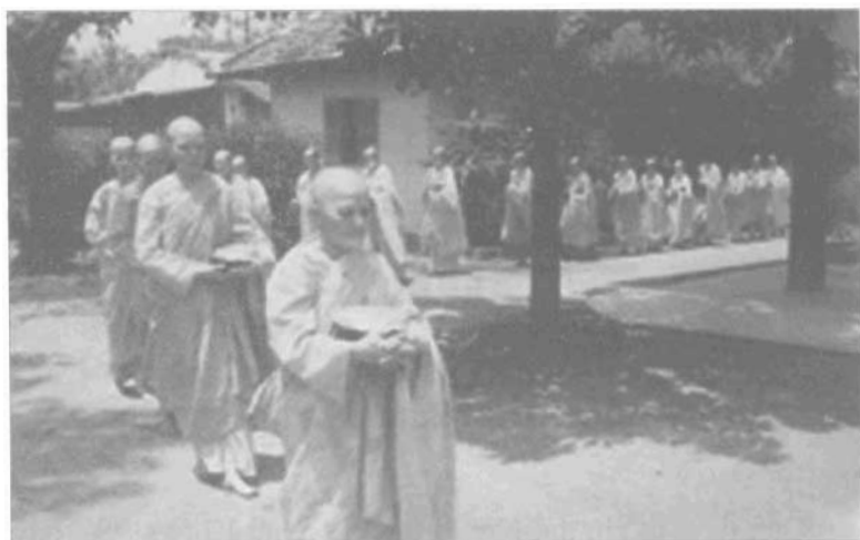
Đoàn ni giới Khất sĩ đi khất thực.