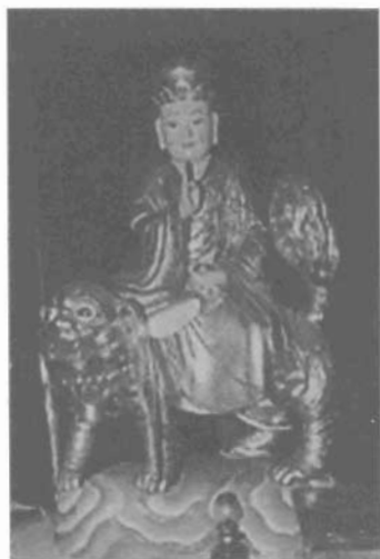
Tượng Địa Tạng bằng đất sét.

trượng đuổi đi. Muốn được giải thoát, phải ngộ mười hai nhân duyên. Tay của Địa Tạng Vương bồ tát cầm tích trượng có mười hai khoen để nói lên ý nghĩa vị bồ tát này luôn dùng pháp thập nhị nhân duyên cảnh tỉnh chúng sinh. Tuy nhiên, muốn thấu rõ lý nhân duyên phải nhờ có ánh sáng trí tuệ. Đạo Phật quan niệm chúng sinh trầm luân mãi mãi bởi vô minh che lấp, không trông thấy pháp duyên sanh, nên cứ lẩn quẩn trong vòng luân hồi. Muốn phá được vô minh phải phát huy trí tuệ. Trí tuệ tăng trưởng thì vô minh sẽ lùi xa. Biểu thị của trí tuệ là viên minh châu trong lòng bàn tay của Địa Tạng Vương bồ tát. Một tay cầm hạt minh châu, ngồi trên mình Đề thính. Theo quan niệm, tay cầm hạt minh châu vì minh châu phát ra ánh sáng, có thể soi đường cho vị bồ tát vào cõi u minh, tăm tối để cứu vớt vong linh chưa được siêu thoát.