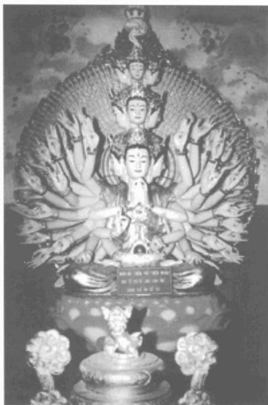
Tượng Quan Âm nghìn mắt nghìn tay.

Thiên nhãn để thấy khắp thế gian và thiên thủ để ra tay cứu vớt chúng sinh.