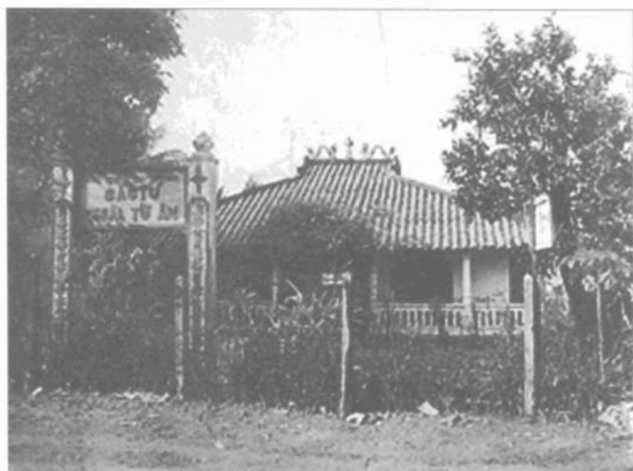
Chùa Sắc tứ Từ Ân.

1791. Vua Minh Mạng ban tặng "Sắc tứ Từ Ân Tự". Cuối thế kỷ XIX, chùa dời về vị trí hiện nay.