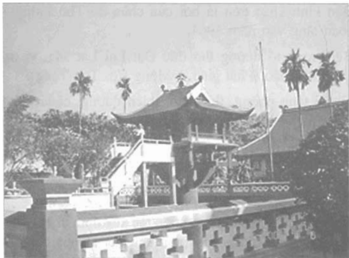
Chùa Một Cột

đứng trong vườn chùa. Chùa còn có hồ nước vuông mang tên Long Nhân, bên trong thả hàng vạn con cá nhiều loại và rùa. Giữa hồ nước này là ngôi chùa Một Cột. Pho tượng chính bên trong là Quan Thế Âm bồ tát trong tư thế 24 tay, bằng gỗ mít, thể hiện đường nét chạm khắc công phu.