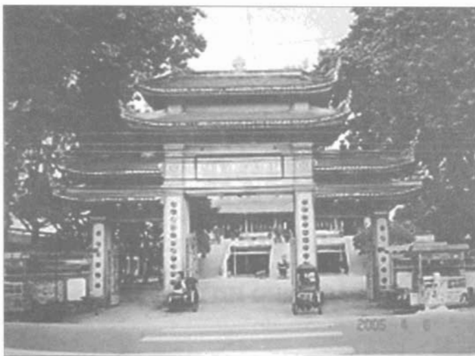
Cổng tam quang chùa Vĩnh Nghiêm.

Giả quan có ý nghĩa xét sự vật, chư pháp đều biến hóa, giả tạm, vô thường. Thể hiện quan điểm vô thường trong giáo lý Phật giáo.