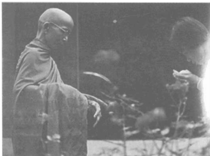
Tu sĩ Nam tông đi khát thực.

Bên trong có y nội, có tác dụng như quần áo lót. Bên ngoài là y vai trái. Khi vấn y, tay phải để lộ ra. Khi đi ra đường, không được để hở vai, nên kéo tấm vải che khuất vai phải.