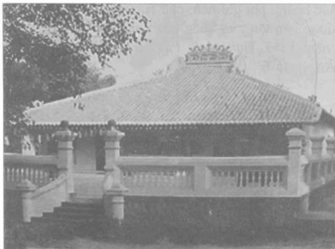
Chùa Giác Lâm

bớt, lập "Phòng tuyến các chùa", gọi là lignes des pagodes , gồm chùa Khải Tường, đền Hiến Trung, chùa Kiểng Phước, chùa Cây Mai. Chùa Khải Tường nằm trong phòng tuyến này cùng với các di tích khác, tất cả đều bị phá hủy vào thế kỷ XIX. Tượng Phật đang thờ tự tại gian chính điện bị vứt ra sân. Đây là pho tượng gỗ, thép vàng, do vua Minh Mạng hiến cúng. Người dân thương cảm đem cất giấu. Sau này, tượng được đưa về trưng bày tại Bảo tàng Lịch sử Việt Nam tại Thành phố Hồ Chí Minh.