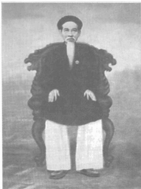
Tôn sư Minh Trí, người sáng lập Tịnh Độ Cư sĩ Phật hội Việt Nam

làm phương pháp tu hành vì nó dễ áp dụng đối với mọi người. Cư sĩ là người tu tại gia không bắt buộc từ bỏ gia đình, xuống tóc. Tuy nhiên trong Hội vẫn có người xuất gia. Ông nêu bật tôn chỉ "Phước Huệ song tu" nghĩa là cùng lúc thực hành tu Phước và tu Huệ. Theo ông, đạo đức phải được xem là nền tảng của xã hội. Các chùa ở địa phương được đặt tên thống nhất chữ đầu là Hùng chữ cuối là Tự , ở giữa thay đổi tên riêng, là địa danh của vùng. Từ khi thành lập, Tịnh Độ cư sĩ Phật hội Việt Nam đã có gần 200 ngôi chùa toàn miền Nam, chùa nào cũng có phòng hốt thuốc bên cạnh.