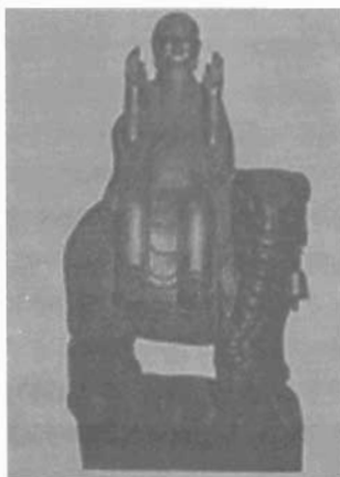
Tượng Phổ Hiền bồ tát

Thế Âm bồ tát. Điểm này có khác với bộ tượng 5 vị trong các ngôi chùa Việt cổ ở Nam Bộ gồm Phổ Hiền bồ tát, Đại Thế Chí bồ tát, Thích Ca Mâu Ni Phật, Quán Thế Âm bồ tát và Văn Thù Sư Lợi bồ tát.