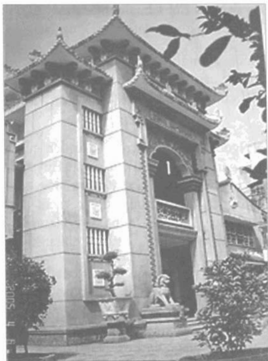
Chùa Ấn Quang

Chùa Giác Lâm là một di tích có bề dày lịch sử, xưa nhất ở Thành phố Hồ Chí Minh, cách nay đã 262 năm.