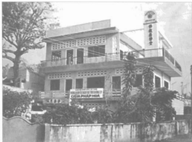
Phòng khám tử thiện Tuệ Tính Đường của chùa Pháp Hoa

cán bộ hưu trí... Một phòng khám bệnh miễn phí cũng được mở ra phục vụ bà con nghèo tại chùa Pháp Hoa, quận Phú Nhuận từ năm 1992. Mỗi tuần ba ngày vào thứ ba, năm, bảy khám và bốc thuốc miễn phí. Thời gian còn lại học viên học lý thuyết, tham gia bào chế thuốc, dưới sự hướng dẫn của bác sĩ, lương y. Ngoài việc châm cứu, xoa bóp, bấm huyệt, phòng khám còn bốc thuốc Nam, thuốc tễ, thuốc hoàn, dầu xoa và một số tân dược khác. Bình quân mỗi ngày, phòng khám và bốc thuốc cho 200 - 300 bệnh nhân. Trong một năm, số lượt người đến khám đã lên đến 40.000 người.