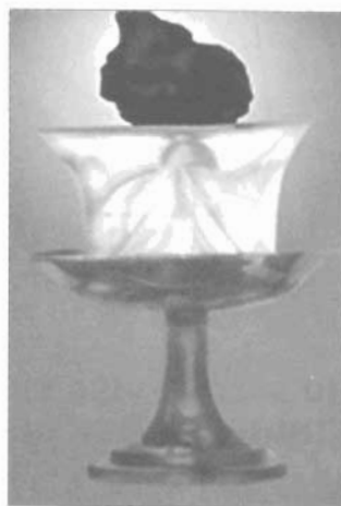
Trái tim của Thích Quảng Đức.