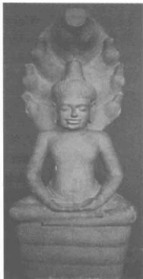
Tượng Thích Ca bằng đá vớt từ đáy sông Đồng Nai.

về một phía. Sáu đầu rắn đều hướng nhìn lên đầu rắn to nhất ở giữa.