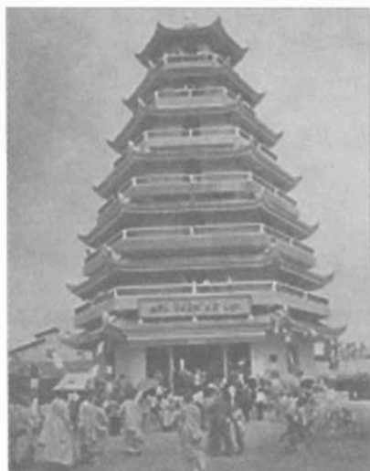
Tháp Ngũ gia tông phái của chùa Giác lâm.

Chùa Giác Lâm tôn trí xá lợi trên tầng bảy của tháp Ngũ Gia tông phái, còn được gọi là Bửu tháp xá Lợi, được xây dựng vào năm 1972, sau đó bị gián đoạn một thời gian và tái xây dựng để hoàn thành tháp vào năm 1994. Xá lợi tại chùa Giác Lâm do hòa thượng Narada tặng vào năm 1953, được đưa từ Sri Lanka về.