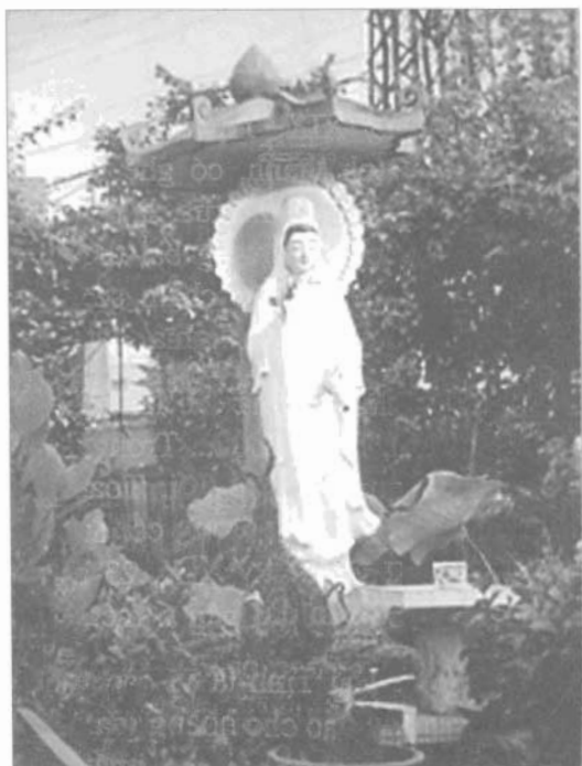
Tượng Quan Âm Nam Hải.

có con chim đậu. Hình tượng này muốn nói lên hạnh nhẫn nhục của Quan Âm.