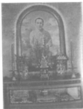
Chân dung Tổ sư Minh Đăng Quang.

xa nhà bá tánh trăm thước... Mặt tiền tam bảo hướng về phía tây. Chung quanh có hàng rào cao 2 mét. Theo quy định, sáng 7 giờ mở cửa tịnh xá và chiều 5 giờ đóng lại cho các sư tu tịnh. Trong tịnh xá thuộc hệ phái Khất sĩ, do quan niệm thờ phụng cần đơn giản, thanh tịnh nên trong tháp 13 tầng, duy nhất chỉ có tượng Thích Ca Mâu Ni Phật. Ngoài ra còn có bàn thờ dành cho tổ sư Minh Đăng Quang, người sáng lập hệ phái Khất sĩ. Trong tịnh xá cũng có bàn thờ chung, còn gọi là bàn Hội đồng, của Cửu Huyền thất tổ, để Phật tử đưa hình ảnh ông bà cha mẹ đã quá cố vào đặt thờ. Do quan niệm tất cả Phật tử đều cùng có chung một họ Phật, từ thờ tự một người đến thờ phụng cả họ, để có thể đến với sự thờ phụng chung cho cả chúng sinh.