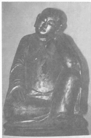
Tượng La Hán ở chùa Giác Lâm.

Bên cạnh một nguồn gốc về các La Hán nêu trên, còn có một sự tích về Thập Bát La Hán được giáo thọ Hoàng Khai, chùa Càn An, Bình Định, năm Tự Đức thứ 4 (1851) lược dịch từ bản chép tay bằng chữ Hán. Theo tích này thì 18 vị La Hán vốn là con của công chúa Hy Đạt, nước Triệu.