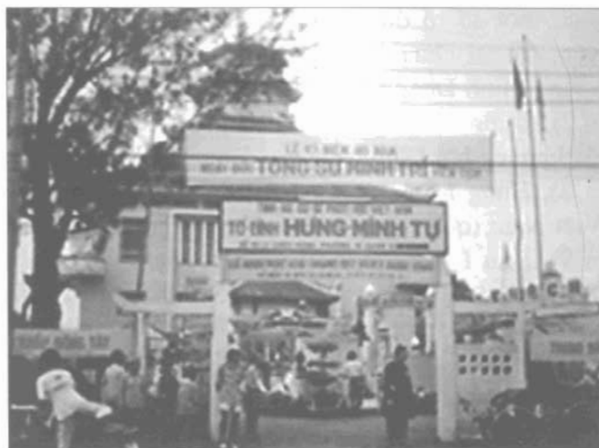
Tổ đình Hưng Minh tự

của bài kệ là tên người xuất bài kệ. Ví dụ như dòng Lâm Tế Tổ Đạo, có bài kệ: