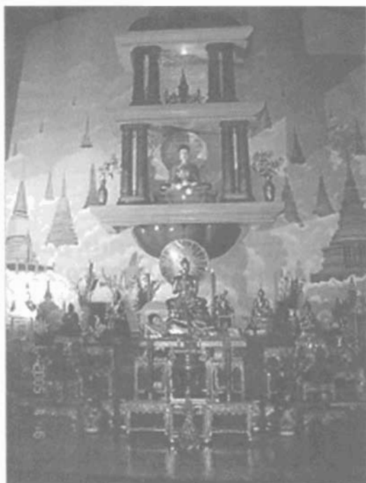
Chính điện chùa theo Phật giáo Nam tông.