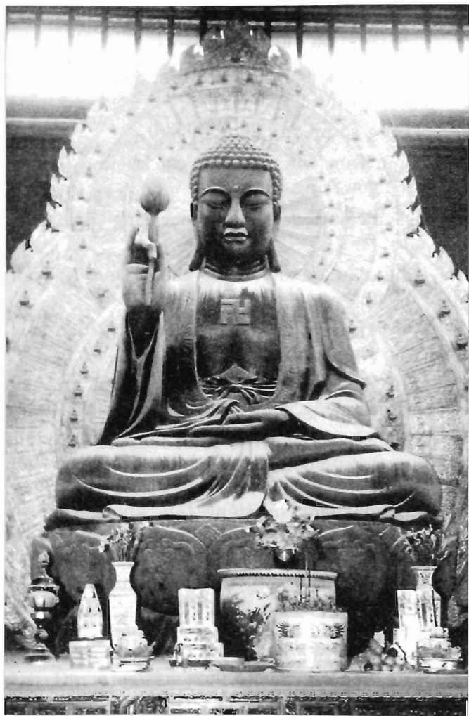
Tượng Phật A Di Đà bằng đồng nặng 100 tấn thờ ở Điện Pháp Chủ, chùa Bái Đính