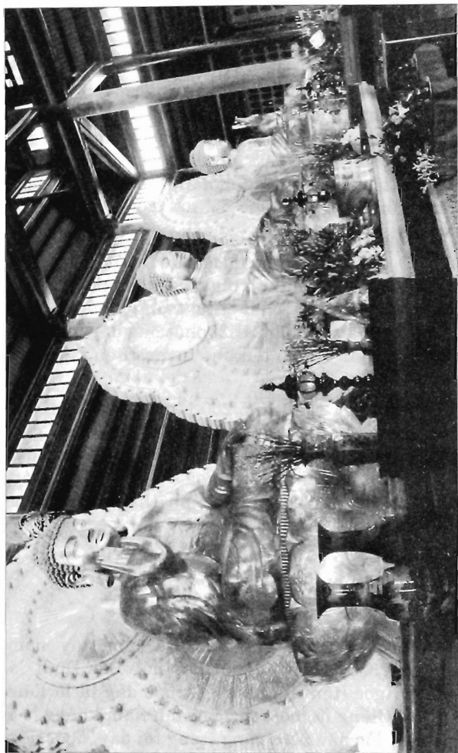
Ba pho tượng Tam thế bằng đồng mỗi pho nặng 50 tấn, thờ ở điện Tam thế, chùa Bái Đính.