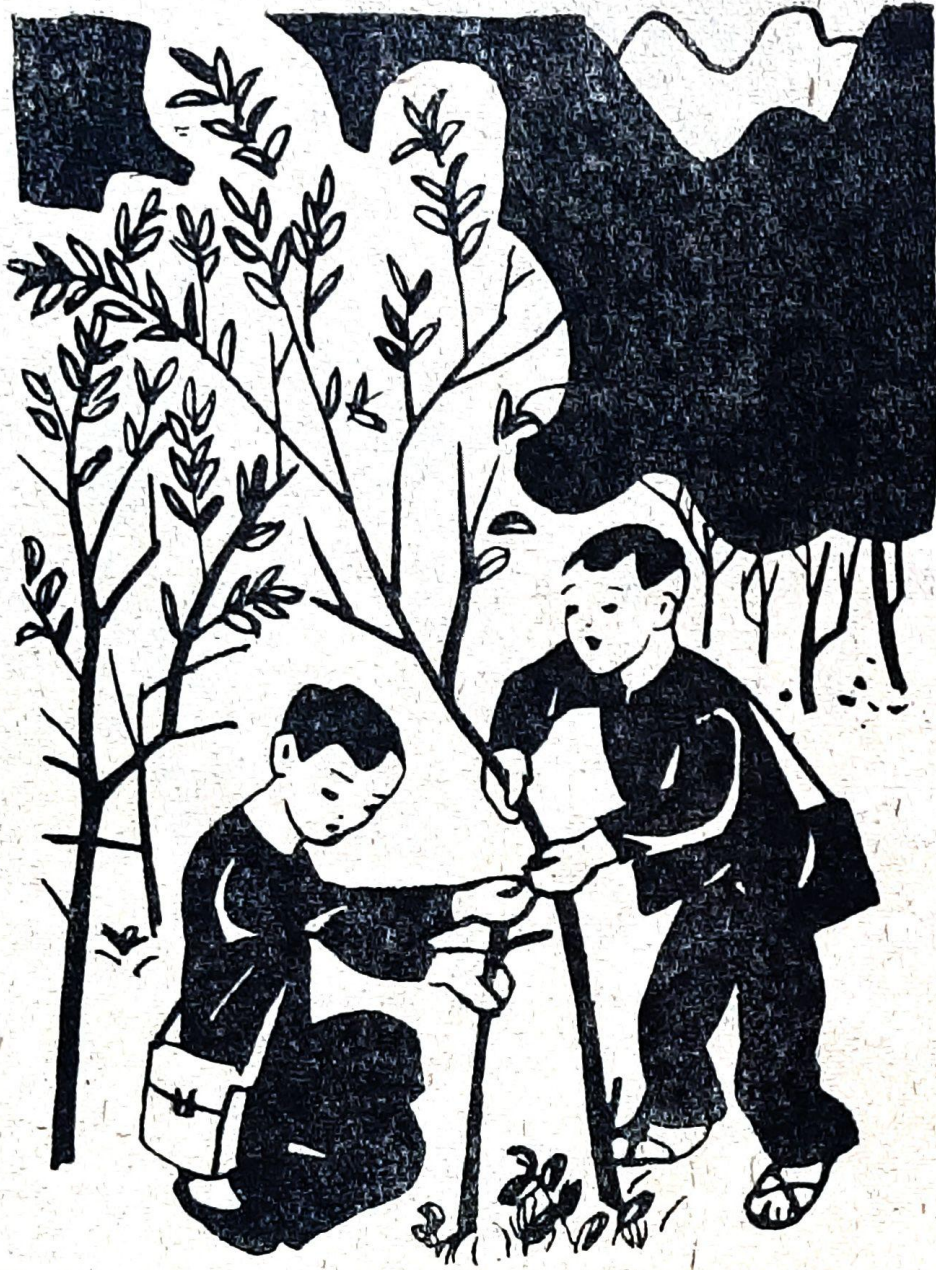
Lâm và Tỏa đã tìm que chống cho cây đứng thẳng.