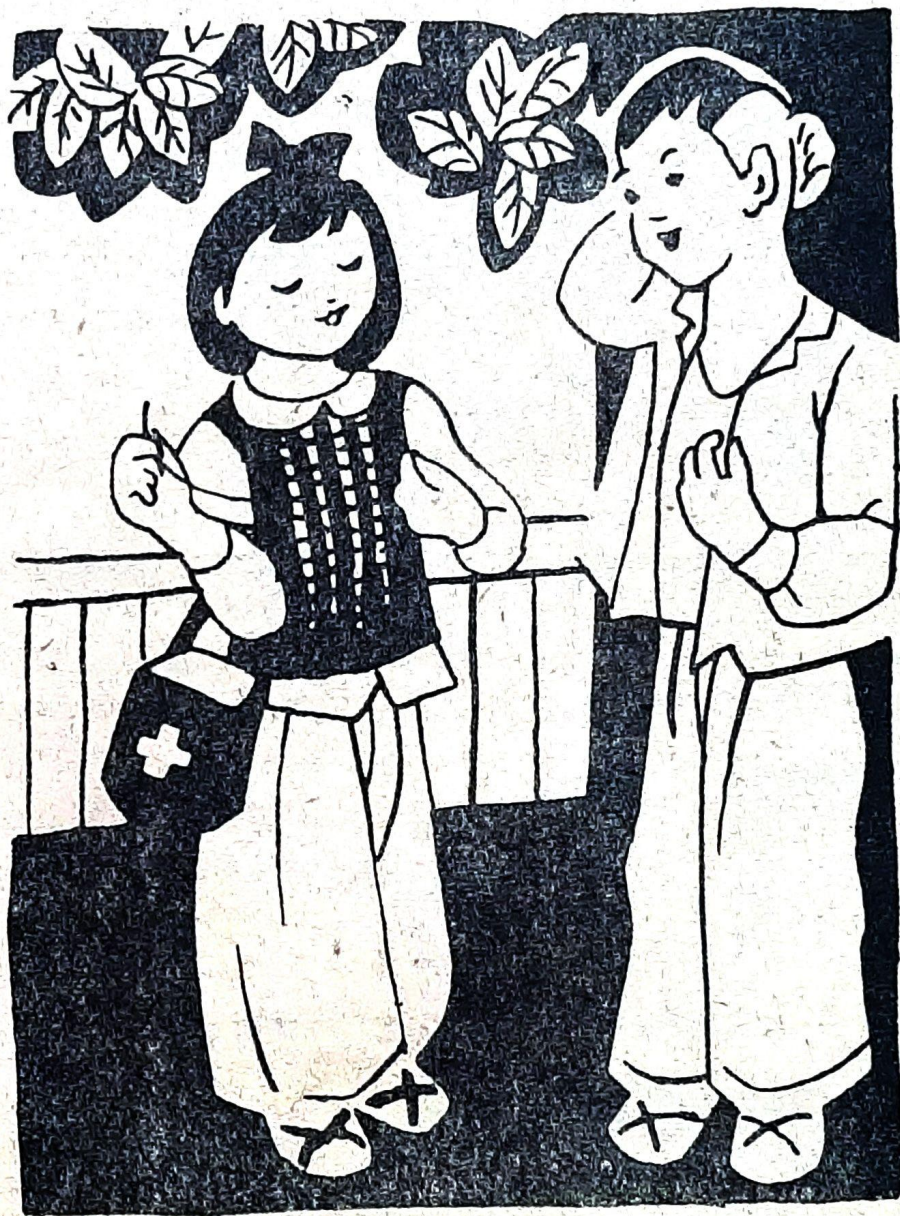
Ngọc vừa khâu chỉ, vừa hỏi...