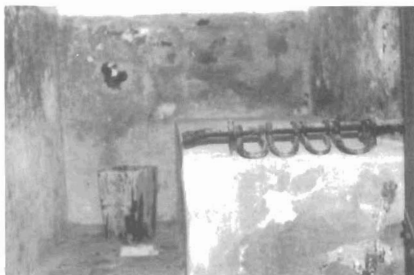
Bên trong một căn Hầm Đá Trại 2