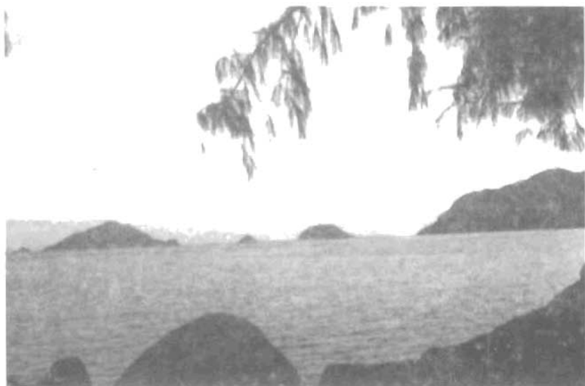
Hòn Trác - Hòn Tùi (Côn Đảo)