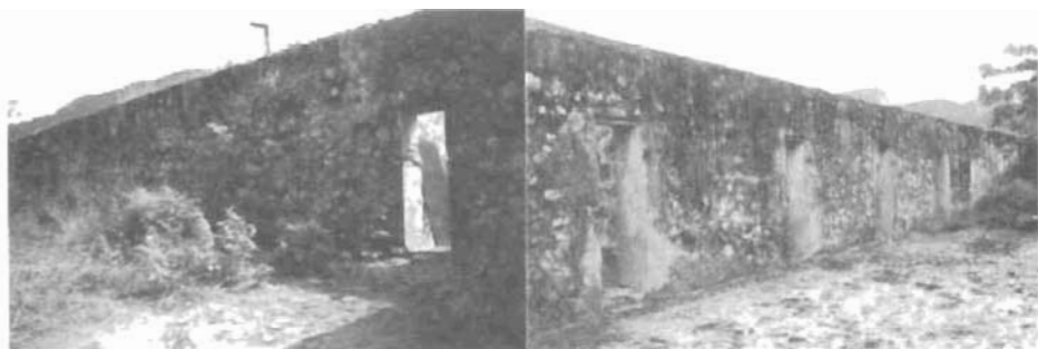
Đằng sau khung cửa hẹp này là khu Chuông Cọp