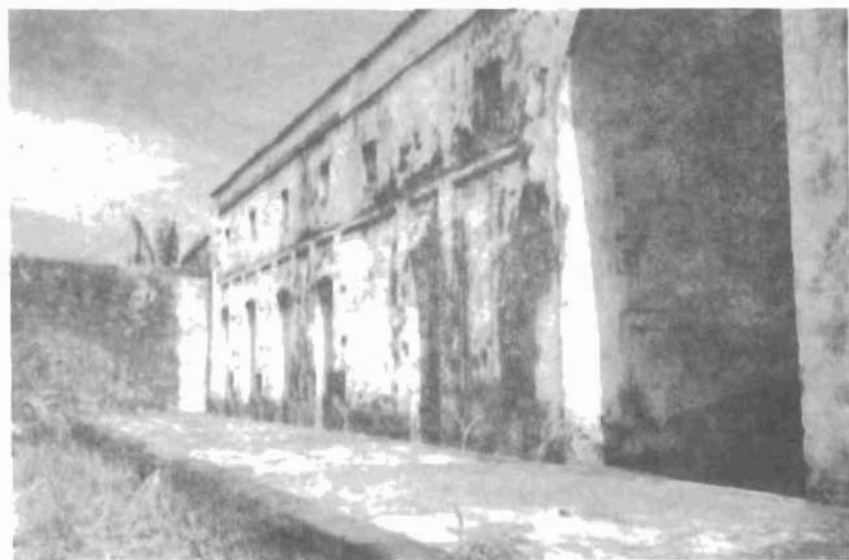
Hầm Đả Trại 2 Côn Đảo, nơi khai thác và hành hạ tù đầu tranh