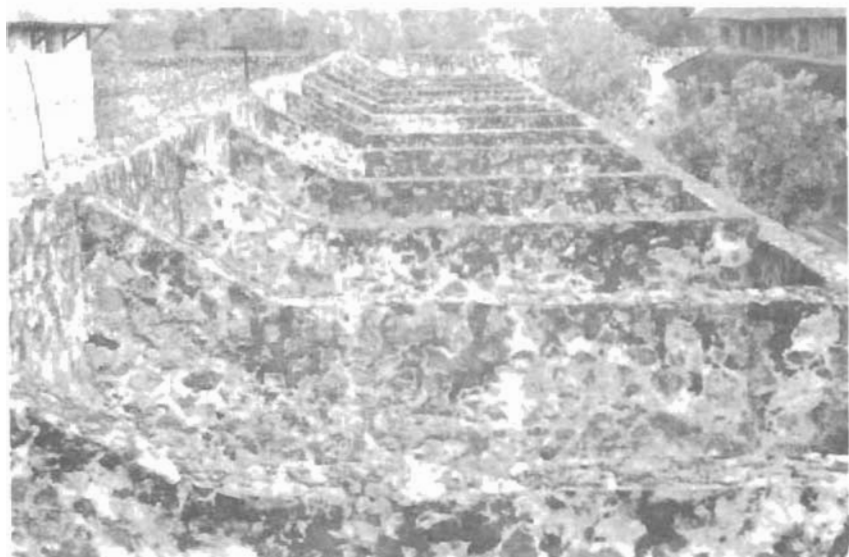
Chuồng Cọp cũ trước 1940