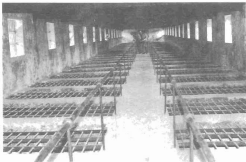
Chuồng Cọp Pháp xây dựng năm 1940