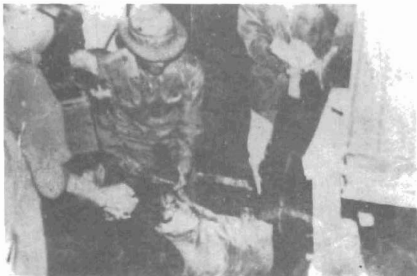
Nữ tù chính trị Côn Đảo đang bị đàn áp