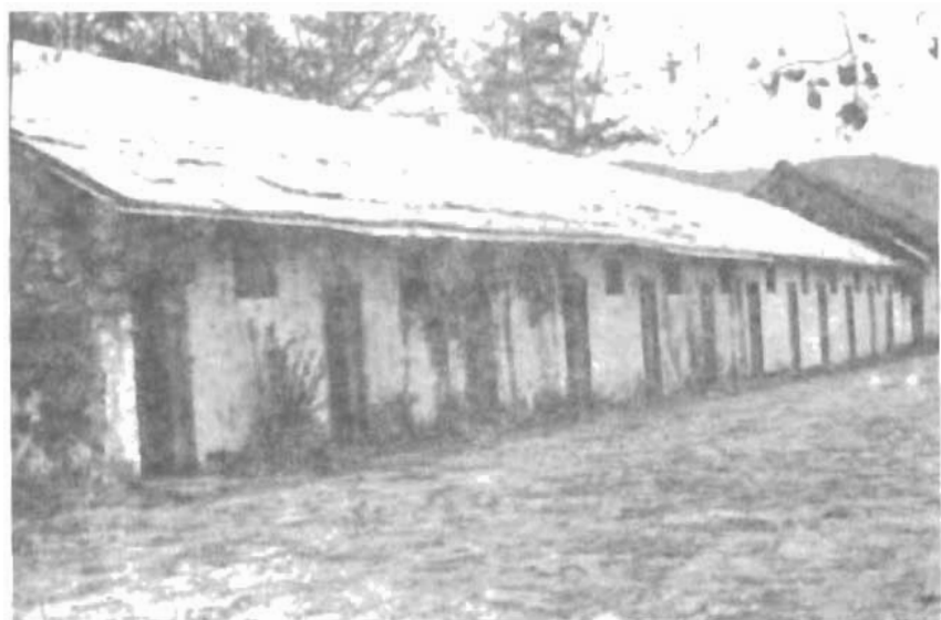
Trại Chuồng Bò: dãy lợp ngói cỏ từ thời Pháp, dãy lợp tôn thời Mỹ