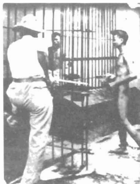
Tù nhân khi ra vào khám giam đều bị cai ngục kiểm soát chặt chẽ, vô nhân đạo