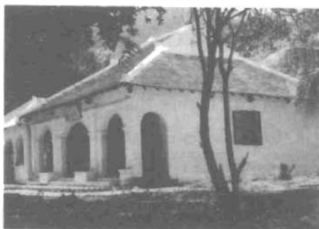
Miếu An Sơn thờ bà Phi Yến