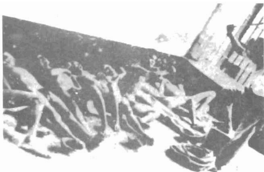
Một kiểu tra tấn người tù tại hầm xay lúa Banh I (thời Pháp)