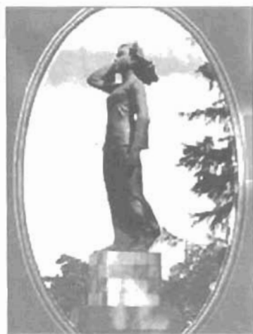
Tượng đài Võ Thị Sáu tại Côn Đảo

Ngày 2 tháng 8 năm 1993, chị Võ Thị Sáu đã được nhà nước công nhận là Liệt sĩ Công