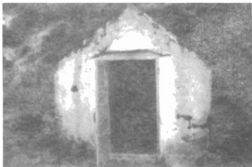
Hầm (hố) phân bón trong khu Chuồng Bò: nơi khai thác ghê rợn