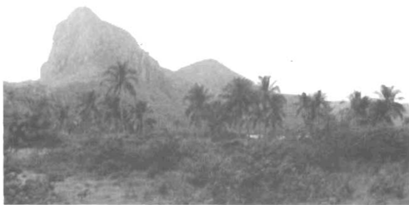
Đỉnh Tình yêu (Côn Đảo)