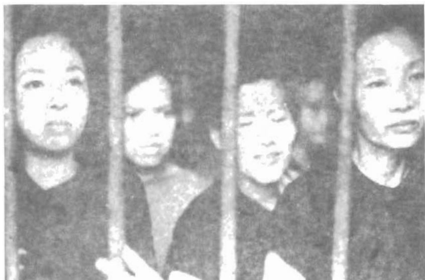
Nữ tù chính trị trong Chuồng Cọp Côn Đảo