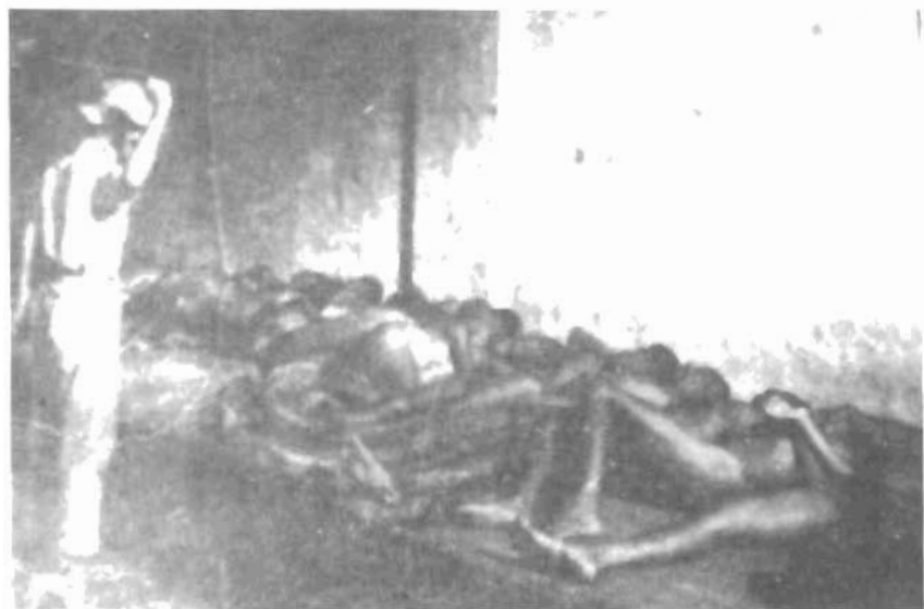
Ngũ cũng bị tra tấn