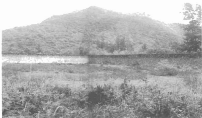
Bãi hấp tù nhân nằm sau Banh III phụ